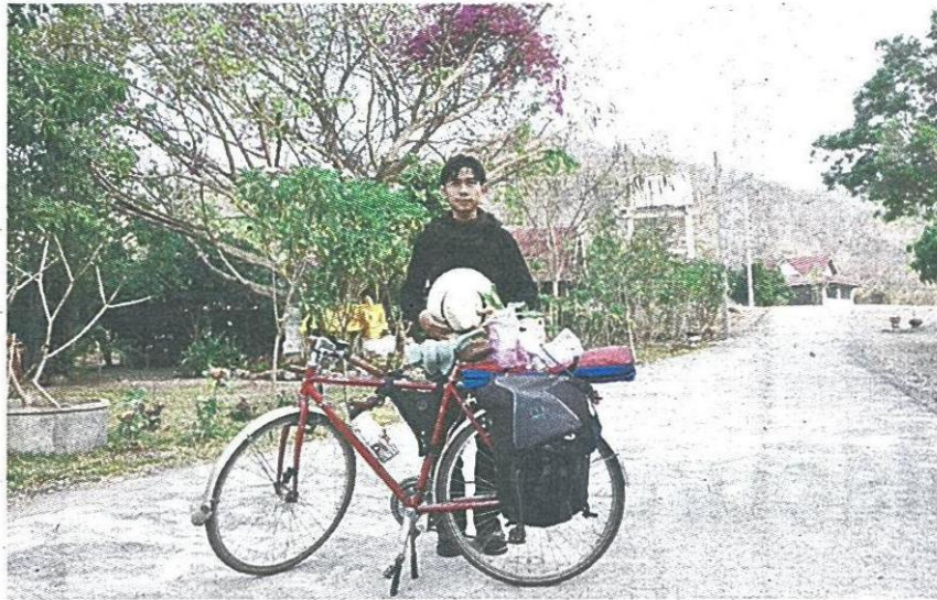
พาอารยาตามหาใจ